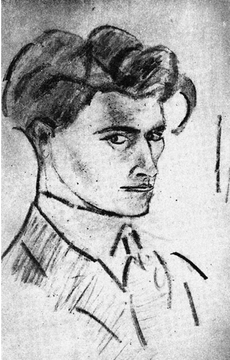
Antonin Artaud: autoritratto (1915)